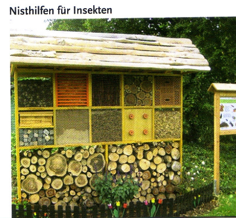
Nisthilfen für Insekten